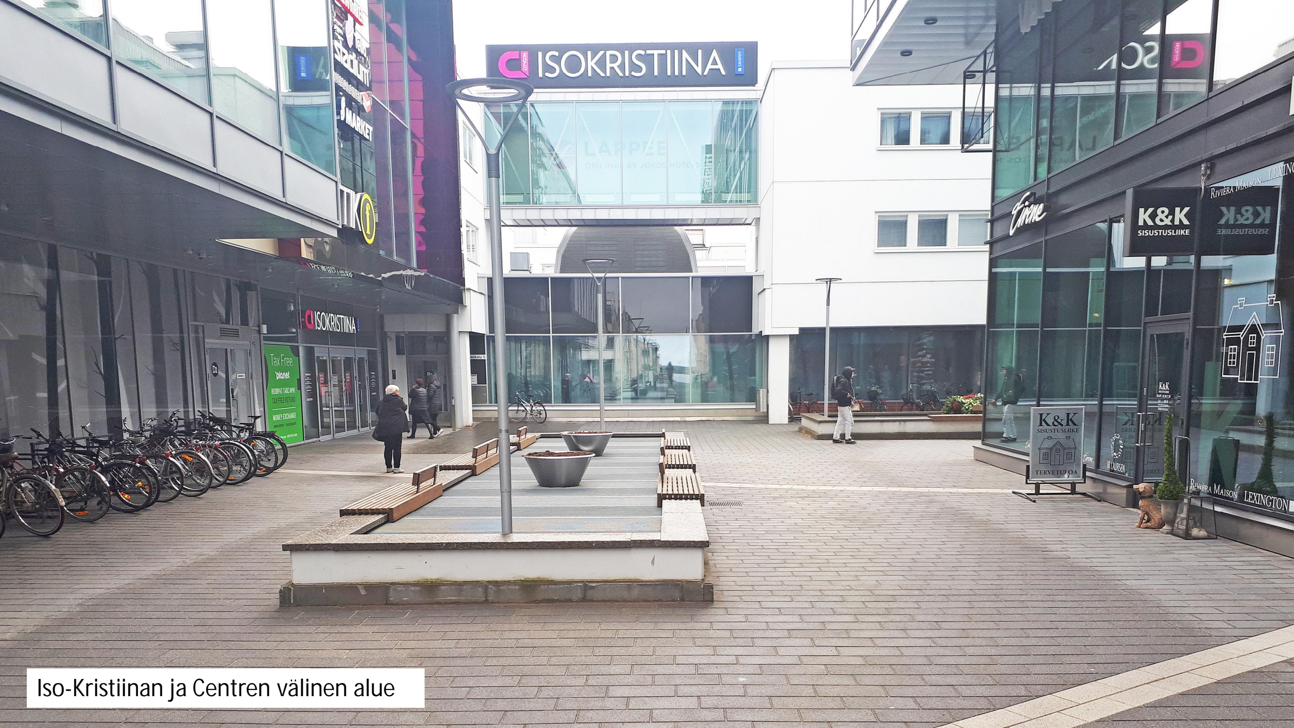
Iso-Kristiinan ja Centren välinen alue